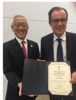
ツーリズムアワード、今年「ランデヴー・アン・フランス」でフランス観光開発機構がビジネス部門賞を受賞