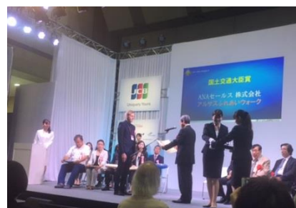
ツアーグランプリ 2017 授賞にて ANA セールスの受賞の模様