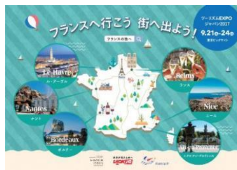
「フランスへ行こう、街へ出よう！」 Web 特設ページ