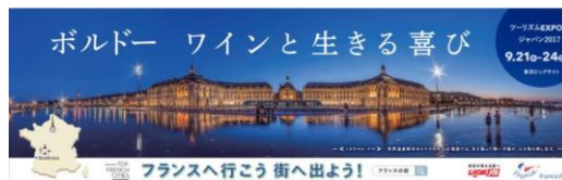
「フランスへ行こう、街へ出よう！」 交通広告