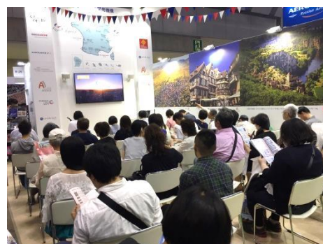
フランスブースでは各種セミナーを毎日実施