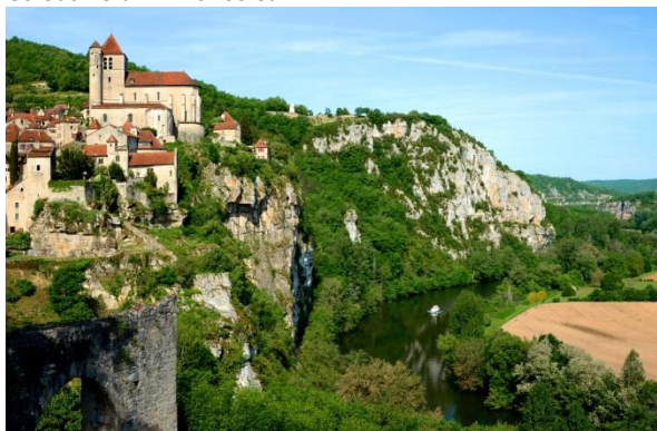
Saint Cirq Lapopie, élu comme l'un des « plus beaux villages d'Europe » par la JATA, Association japonaise des agents de voyage