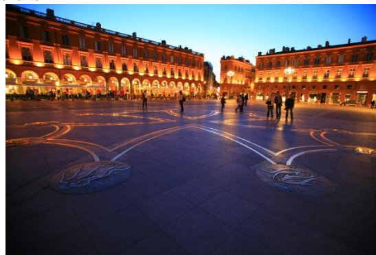
Place du Capitole de Toulouse, capitale de la région Occitanie.