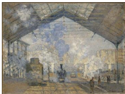
Claude Monet, La gare Saint-Lazare , 1877, Musée d'Orsay, Paris