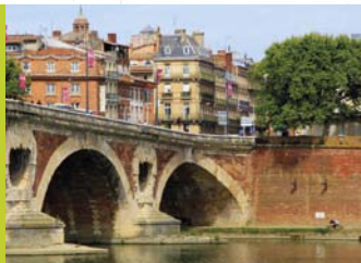
ボン・ヌフ橋 LE PONT NEUF