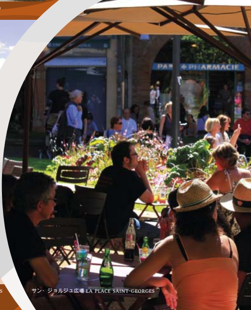
サン・ジョルジュ広場 LA PLACE SAINT-GEORGES