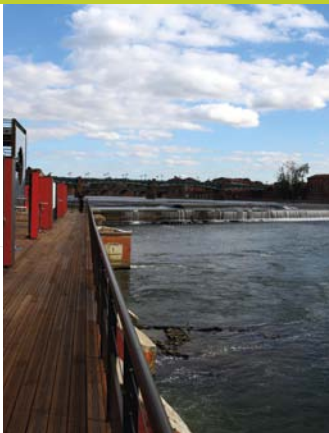
ガロンヌ川の洗ひ越し「バザクル BAZACLE」

現代的でコスモポリタンな魅力にあふれるトゥールーズ。その一方でこの町は、緑と水辺を調和させた、人にやさしい空間も大切にしてきました。市内は徒歩や自転車で簡単に見て回ることができ、川や運河のクルージングも楽しめます。ユネスコの世界遺産に登録されているミデイ運河や、数多くある庭園や公園はみな、自然の中で散歩やスポーツを楽しんだり、のんびり気ままなひとときを過ごしたりするのにうってつけ。旧市街の中心部を流れるガロンヌ川は町の魂とも言える存在で、岸边はトゥールーズっ子の憩いの場となっています。