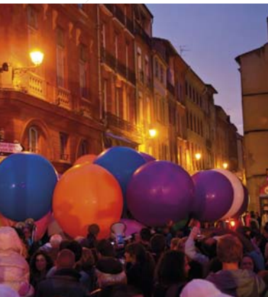
市内の通りを練り歩くパレード