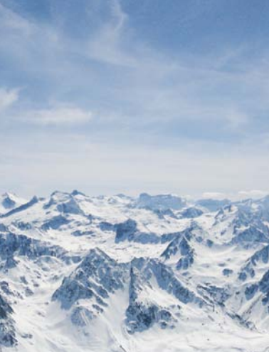
ピレネー山脈 LES PYRÉNÉES