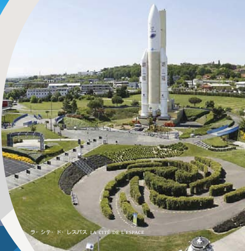
ラ・シテ・ド・レスパス LA CITÉ DE L'ESPACE