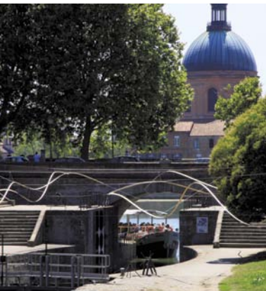
運河のクーレージグ

比類のない文化遺産を抱えるトゥールーズには嬉しい驚きが一杯。パステル*交易の黄金期に建てられた美しい邸宅、レンガと石で飾られた宗教建築物、歴史ある建物や工場跡に設けられた充実のミュージアム・・・どれもみな、驚嘆のため息をついてしまうものばかり。市内の路地を散策し、モニュメントをめぐるだけで、この「バラ色の町」の歴史と魅力に触れることができます。夜になれば町はイルミネーションで飾られ、ファサードが、ガロンヌ川が、モニュメントが、昼間とは違う顔を見せてくれます。*パステル：青色染料を採るために特に16世紀に栽培されていた植物