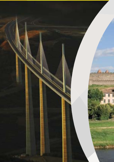
ミヨ一高架橋 LE VIADUC DE MILLAU