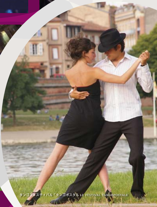
タンゴフェスティバル「タンゴポスタル LE FESTIVAL TANGOPOSTALE