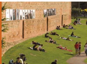
レーモン6世公園 JARDIN RAYMOND VI