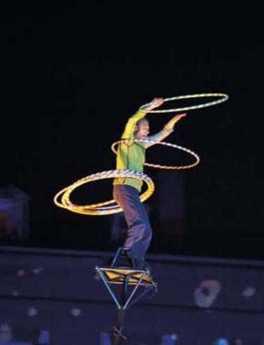
トゥールーズ・アン・ピスト