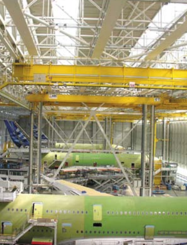
エアバス社組立工場