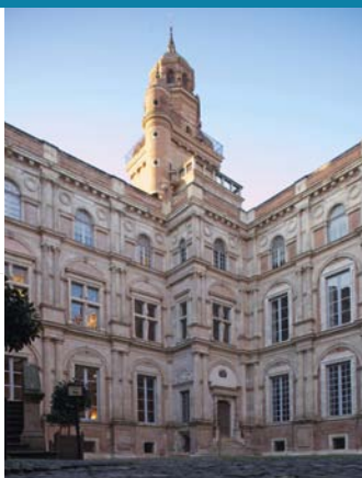
アセザ館 L'HÔTEL D'ASSÉZAT

比類のない文化遺産を抱えるトゥールーズには嬉しい驚きが一杯。パステル*交易の黄金期に建てられた美しい邸宅、レンガと石で飾られた宗教建築物、歴史ある建物や工場跡に設けられた充実のミュージアム・・・どれもみな、驚嘆のため息をついてしまうものばかり。市内の路地を散策し、モニュメントをめぐるだけで、この「バラ色の町」の歴史と魅力に触れることができます。夜になれば町はイルミネーションで飾られ、ファサードが、ガロンヌ川が、モニュメントが、昼間とは違う顔を見せてくれます。*パステル：青色染料を採るために特に16世紀に栽培されていた植物