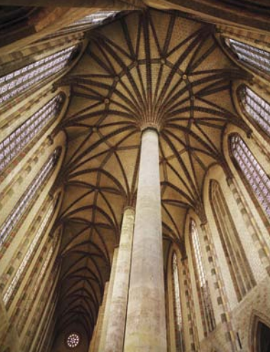
ジャコバン修道院の通称「パルミエ」(椰子の木) LE PALMIER DES JACOBIENS