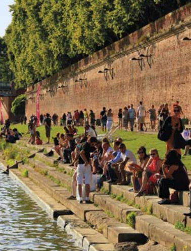
ガロンヌ川の岸辺で過ごすつろぎのひととき