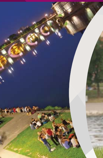
ガロンヌ川の岸辺