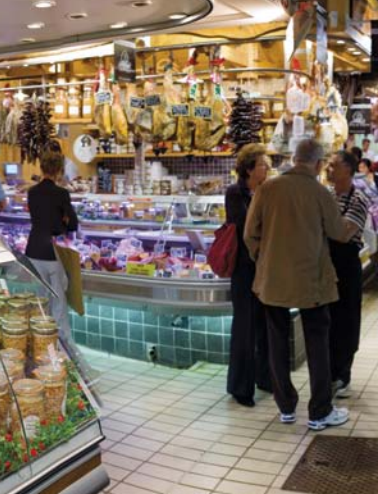
ヴィクトル・ユーゴー市場MARCHÉ VICTOR-HUGO