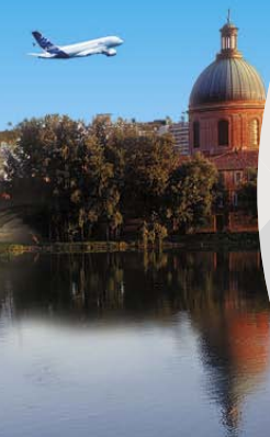
ガロンヌ川の岸辺