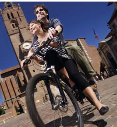
サン・テティエンヌ広場をサイクリング

現代的でコスモポリタンな魅力にあふれるトゥールーズ。その一方でこの町は、緑と水辺を調和させた、人にやさしい空間も大切にしてきました。市内は徒歩や自転車で簡単に見て回ることができ、川や運河のクルージングも楽しめます。ユネスコの世界遺産に登録されているミデイ運河や、数多くある庭園や公園はみな、自然の中で散歩やスポーツを楽しんだり、のんびり気ままなひとときを過ごしたりするのにうってつけ。旧市街の中心部を流れるガロンヌ川は町の魂とも言える存在で、岸边はトゥールーズっ子の憩いの場となっています。