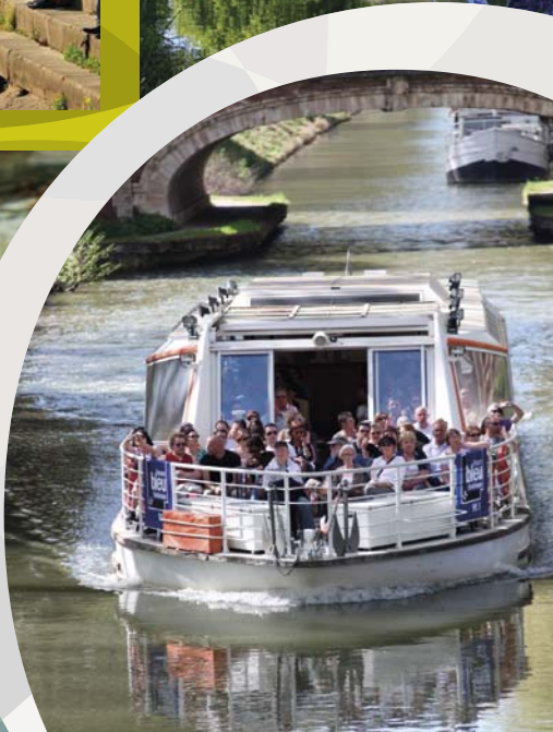
ブリエンヌ運河 LE CANAL DE BRIENNE のクルージング