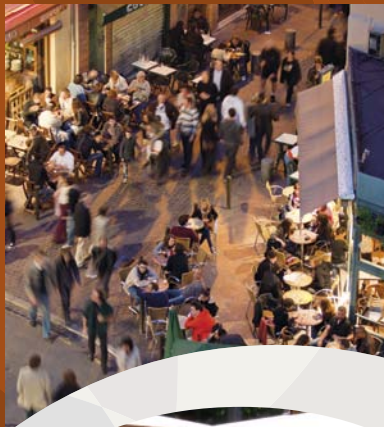
カルム広場 PLACE DES CARMES