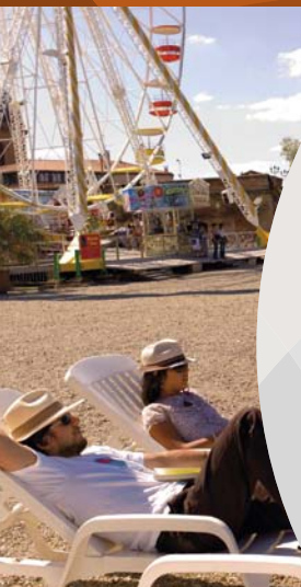
トゥールーズ プラージュ (ビーチ) TOULOUSE PLAGES