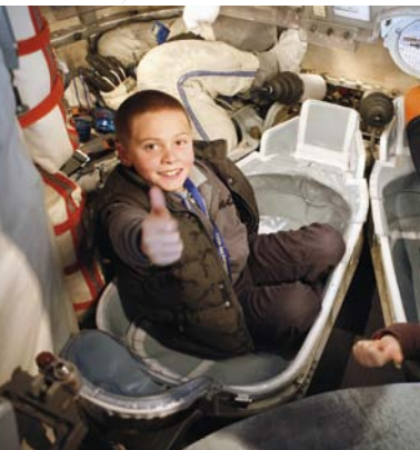
ソユーズの船内 (シテ・ド・レスパス)

クレマン・アデルが発明した空飛ぶマシン「アヴィオン(“飛行機”の意味)」、サン＝テグデュペリなどの英雄たちによって担われた航空郵便の定期便など19世紀末よりトゥールーズは新しい大胆な試みを誕生させてきました。そして今、トゥールーズの研究・技術革新のシンボルとなっているのが超大型旅客機「エアバスA380」です。トゥールーズにあるエアバス社の組立工場は見学可能です。また、トゥールーズは宇宙にもゆかりのある町です。テーマパーク「ラ・シテ・ド・レスパス La Cité de l'espace」ではロケット「アリアース5号」や宇宙ステーション「ミール」の見学や、IMAXシアターやプラネタリウムのショーなど、新しいアトラクションや展示場で、宇宙に関する知識を深めることができます。