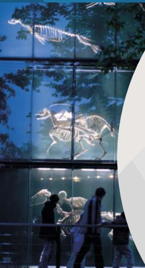
トゥールーズ自然史博物館MUSÉUM D'HISTOIRE NATURELLEにある「骸骨の壁」