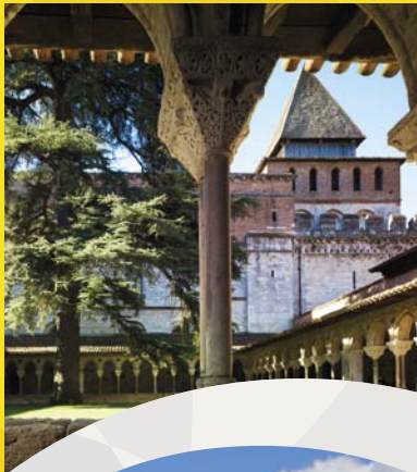
モワサック サン・ピエール修道院の回廊 LE CLOÎTRE DE MOISSAC