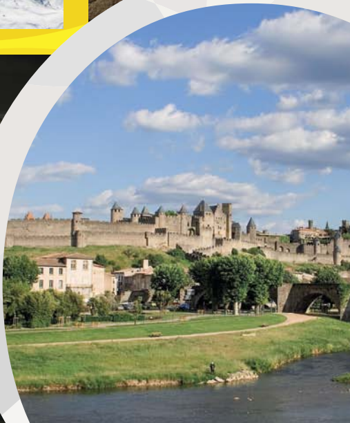
カルカッソンヌ旧市街 LA CITÉ DE CARCASSONNE