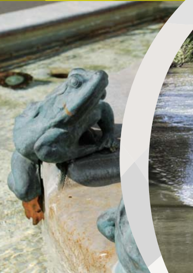
市内にある噴水の一つ