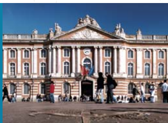
市庁舎 LE CAPITOLE