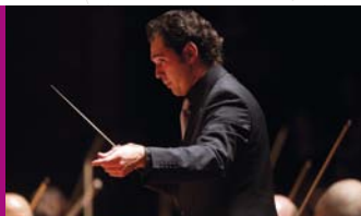
トゥガン・ソキエフ (トゥールーズ・キャピトル国立管弦楽団)

活気と躍動感に満ちた町、トゥールーズ。スペインに近いことから、この町の人々は情熱的で華やかなお祭りが大好きです。トゥールーズっ子の熱き血潮は、地元のラグビーチーム「スタッド・トゥールーズ」や、スマイ色のユニフォームで知られるサッカーチーム「トゥールーズ・フットボール・クラブ (TFC)」の試合でも如何なく発揮されます。文化面でも、音楽フェスティバル「リオ・ロコRio loco」、大道芸人フェスティバル「トゥールーズ・アン・ピストToulouse en piste」、サイエンスフェスティバル「ラ・ノヴラla Novela」のほか、スマイ祭り Fête de la violette、le marathon de Toulouse、カーニバル、トゥールーズ・マラソン、トゥールーズ・プレージュといった数々のフェスティバルやイベントを通じて、新しいトレンドがこの町から次々に生まれています。さらに、映画、演劇、レストラン、カジノ、バー、クラブなどがトゥールーズの充実したナイトライフを演出しています。