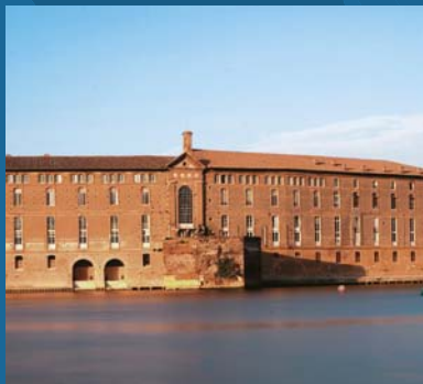
「サンティアゴ・デ・コンポステーラの巡礼路」として世界遺産に登録されているサン・ジャック巡礼院HÔTEL-DIEU SAINT-JACQUESとサン・セルナン寺院BASILIQUE SAINT-SERNIN