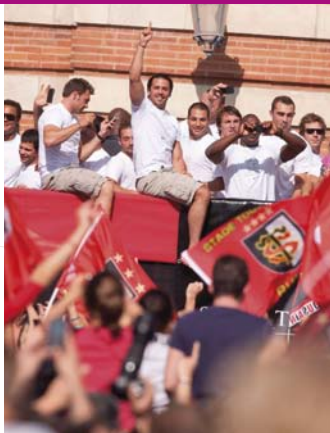
スタッド・トゥールーズ

活気と躍動感に満ちた町、トゥールーズ。スペインに近いことから、この町の人々は情熱的で華やかなお祭りが大好きです。トゥールーズっ子の熱き血潮は、地元のラグビーチーム「スタッド・トゥールーズ」や、スマイ色のユニフォームで知られるサッカーチーム「トゥールーズ・フットボール・クラブ (TFC)」の試合でも如何なく発揮されます。文化面でも、音楽フェスティバル「リオ・ロコRio loco」、大道芸人フェスティバル「トゥールーズ・アン・ピストToulouse en piste」、サイエンスフェスティバル「ラ・ノヴラla Novela」のほか、スマイ祭り Fête de la violette、le marathon de Toulouse、カーニバル、トゥールーズ・マラソン、トゥールーズ・プレージュといった数々のフェスティバルやイベントを通じて、新しいトレンドがこの町から次々に生まれています。さらに、映画、演劇、レストラン、カジノ、バー、クラブなどがトゥールーズの充実したナイトライフを演出しています。