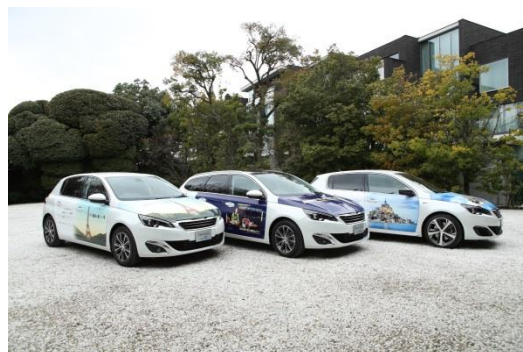
Voitures Peugeot 308 floquées avec les visuels de campagne