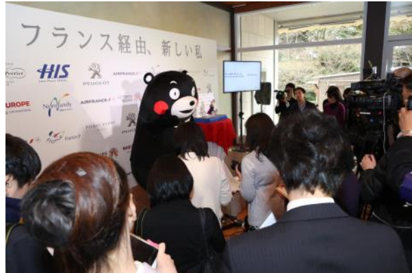
Kumamon et Licca répondent aux questions des journalistes