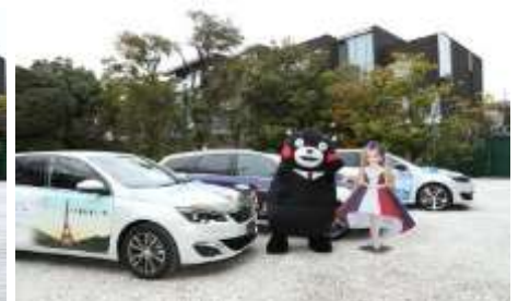
フランスキャラバンのラッピングカーをアピールするくまモンとリカちゃん

フランス観光開発機構は 2017 年度フランス観光キャンペーンパートナーのご参加に感謝申し上げます。