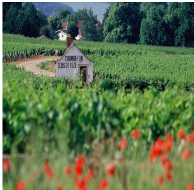
ディジョンの南に広がるコート・ド・ニューイ