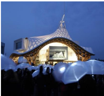
メッス・ポンピドゥーセンター