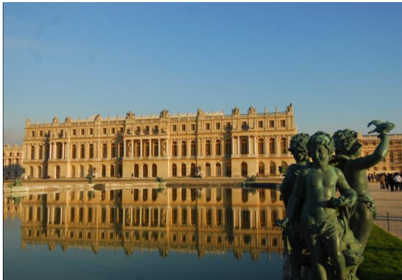
ヴェルサイユ宮殿 © Mairie de Versailles