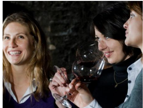
ディジョン、ワイナリーで試飲