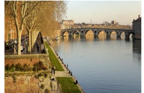
トゥールーズ、ミディ運河