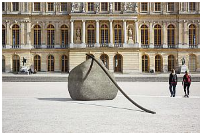
Photomontage pour Relatum - The Cane of Titan , 2014 © ADAGP Lee Ufan Courtesy the artist ; kamel mennour, Paris and Pace Gallery, New York