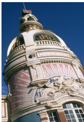
ナントのリュ・ユニック