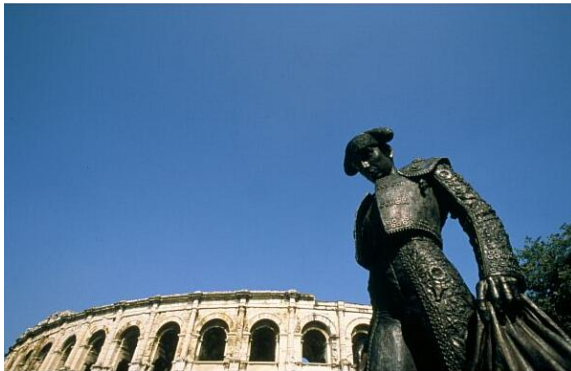
ニーム、円形闘技場