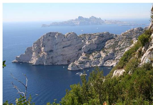
マルセイユ近郊のカランク © SZS.JPG