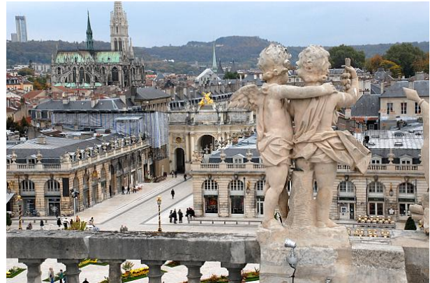
ナンシー、スタニスラス広場