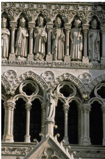
アミアン、ノートル・ダム大聖堂