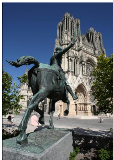
ランス、ノートル・ダム大聖堂 © Michel Jolyot