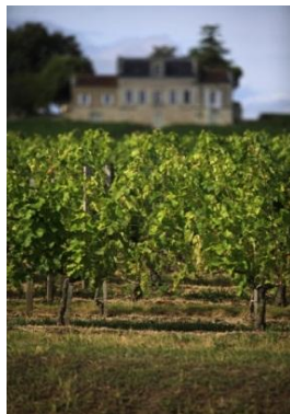
ボルドー近郊サンテミリオンของブドウ畑