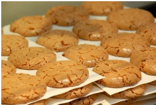
ナンシーのマカロン