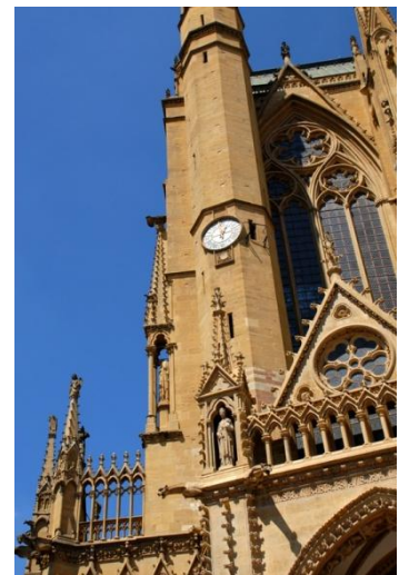
メッス、サンティエンヌ大聖堂