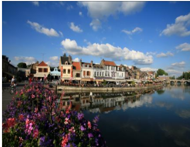
アミアン、サン・ルー地区の水路