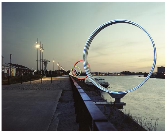
ナント「レ・ザノー」