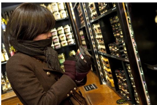
ディジョン、マスタードブランド「マイユ」のショップ