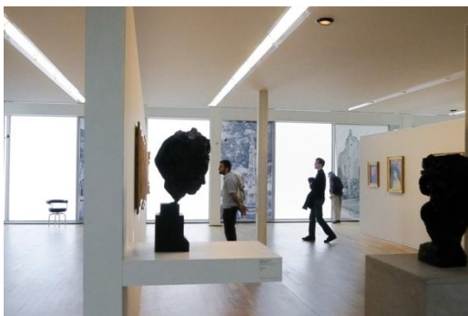
ル・アーヴルのアンドレ・マルロー美術館 (MuMA)