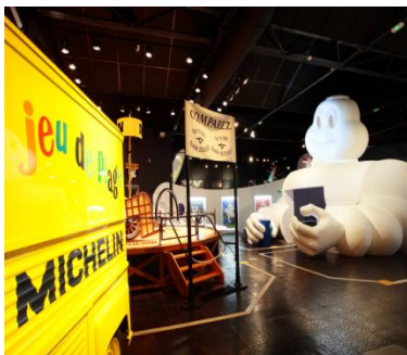
クレルモン・フェランのミシュラン博物館