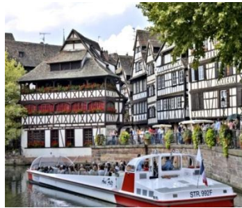
ストラスブールの旧市街プチ・ット・フランス地区