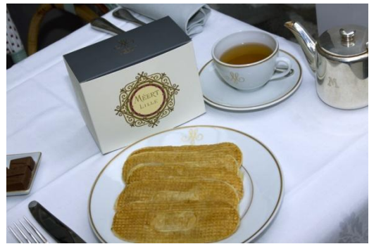
リールのゴーフル