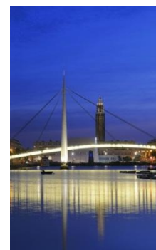
コメルス錨地にかかる橋。後ろにオスカー・ニーマイヤーの文化施設「ヴォルカン」とオーギュスト・ペレのサン・ジョゼフ教会の塔