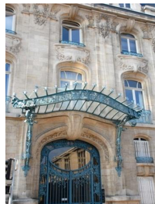
ナンシー、商工会議所入口のアール・ヌーボー建築