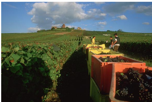
モンターニュ・ド・ランスのブドウ畑