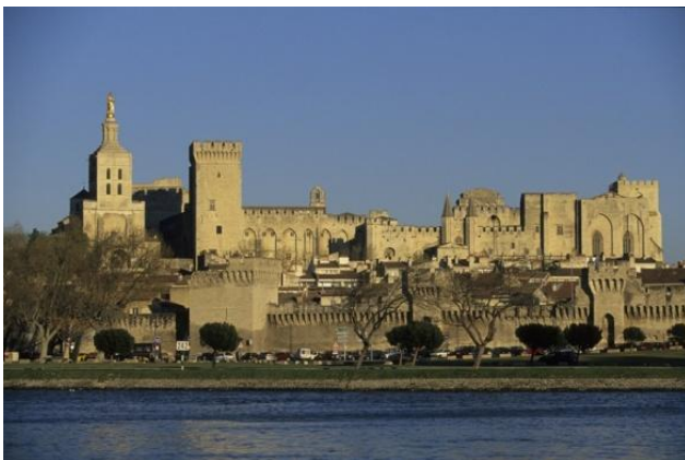
アヴィニョン