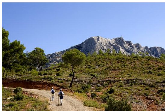
セザンヌが好んで描いたサン・ヴィクトワール山