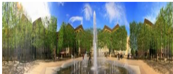
モンペリエ、アンチゴーヌ地区のノンブル・ドール広場